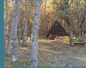
Choza de pastores

La senda nos conduce a través de un denso y valioso robledal hacia los campos de la peña, pasando por los altos de Cantecín y después, entre el robledal, por una antigua choza ganadera ( Choza de los Campos de la Peña ) que ha sido recientemente restaurada, en un enclave magnífico de robles, maillos, serbales y otras muchas especies arbóreas y diversos matorrales y herbáceas.