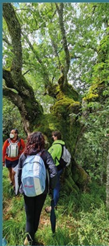
Bosque de Roblones milenarios

Desemboca la senda en las praderas de los Campos de la Peña , lugar de confluencia de varias sendas del municipio y donde los habitantes de la comarca acuden habitualmente a pasear, jugar al golf y disfrutar de sus zonas recreativas, además de ser lugar de pastoreo de las ganaderías locales.